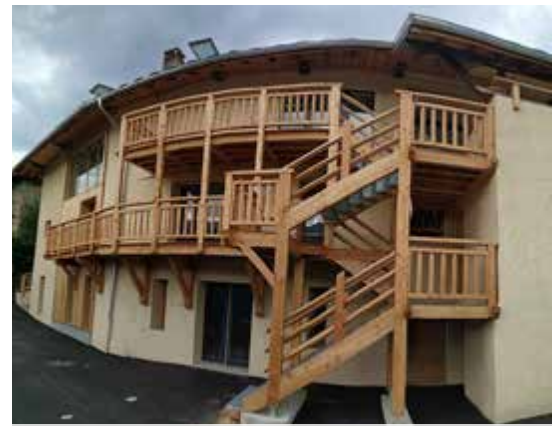
Panoramique de la Maison Fichet dans la Rue des Villandrins

En complément, la rue des Villandrins a fait l'objet d'une réfection complète des enrobés suite aux travaux de réseaux (électricité, éclairage public, fibre, eau potable et eaux pluviales), et la place de la Tour bénéficie d'un embellissement très appréciable, pour une mise en valeur de cet axe principal du hameau. A cette occasion, le stationnement est clarifié, afin de concilier au mieux les possibilités de stationnement et une circulation aisée en traversée du hameau.