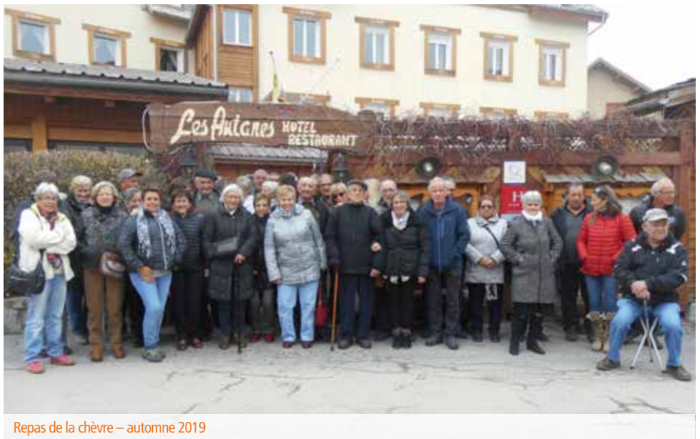
Repas de la chèvre – automne 2019