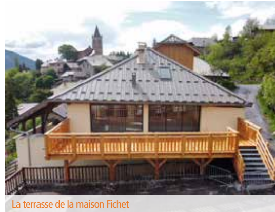
La terrasse de la maison Fichet

Après plus d'une année de travaux dans un contexte contraignant, la maison Fichet a été transformée et a dorénavant fière allure. Grâce au travail de qualité de toutes les entreprises impliquées sur le chantier, et avec l'appui financier décisif de l'Etat (à hauteur de 37%), de la Région Sud-Provence-Alpes-Côte d'Azur (11%) et du Département des Hautes-Alpes (16%), tous les Orrians et les visiteurs vont pouvoir profiter d'un bar-restaurant-épicerie ouvert à l'année, ainsi que d'une médiathèque et de salles polyvalentes. Lieu de rencontres intergénérationnelles, de culture et de services de proximité très attendus, la maison Fichet va combler un manque important sur notre commune.