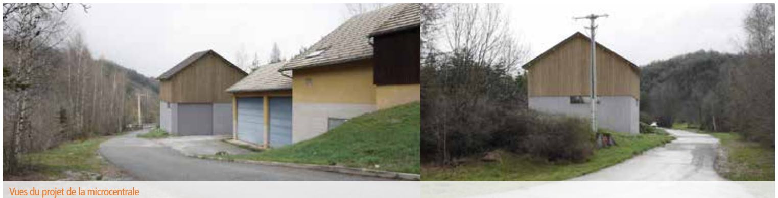
Vues du projet de la microcentrale