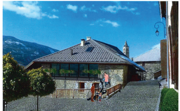
Reconquérir la place de la Mairie pour en faire un lieu de vie est un des objectifs du projet. Ici, la vue du Bistrot de Pays depuis la place réaménagée.

Recréer du lien intergénérationnel, et renforcer l'attractivité de la commune constituent les objectifs principaux de ce projet structurant. Grâce aux aides de l'État (dotation d'équipement des territoires ruraux) et de la Région (fonds régional d'aménagement des territoires), l'acquisition récente des maisons « Fitchet » et « Imbert », à proximité immédiate de la mairie, ouvre des perspectives intéressantes pour mener à bien l'opération « Vie des Orres ».