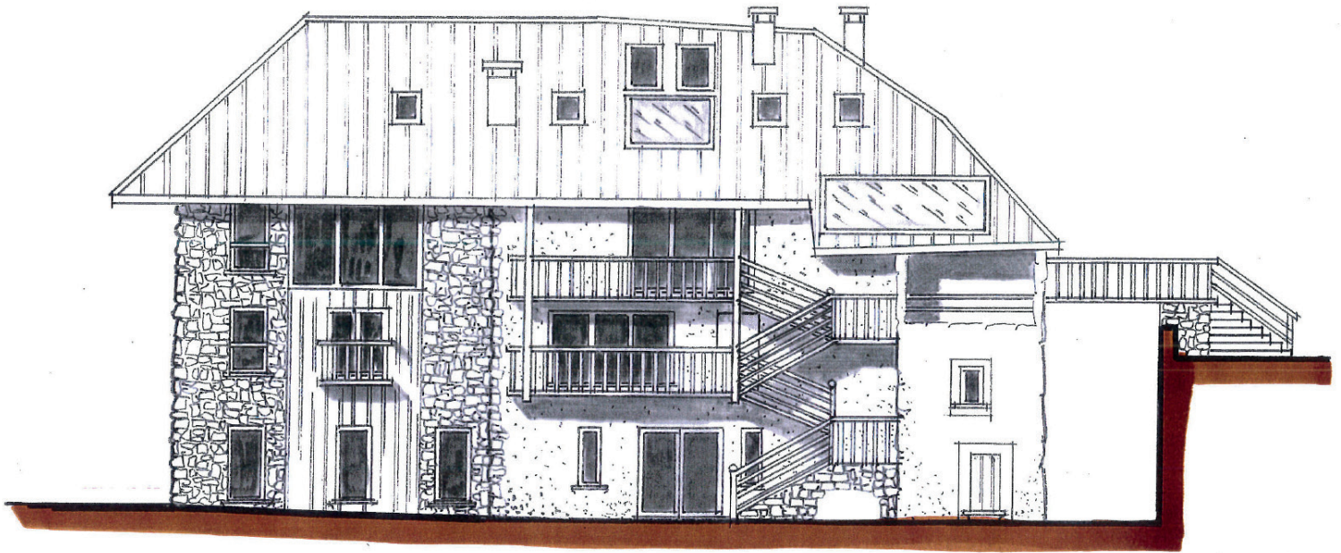
Vue de la Maison des Orrians depuis la rue des Villandrins : la Mairie des Orres souhaite conserver les parties du bâtiment ayant déjà été rénovées et engager la réhabilitation et la remise aux normes de tout le reste du bâtiment.

Ce projet améliorera la circulation et le déneigement dans le Chef-lieu ainsi que la qualité paysagère. La place de la mairie, à l'exception des places PMR sera en effet largement rendue aux piétons. Elle pourra accueillir des espaces de détente faisant émerger une centralité animée au cœur du village.