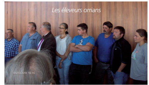
Les éleveurs orriens

Personne n'avait envie de se quitter, mais un programme chargé attendait encore la fédération. Ils ont repris le car, non sans avoir au préalable exprimé le désir de se retrouver dès que possible dans cette belle nature orrienne.