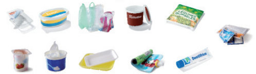
Tous les emballages en plastiques