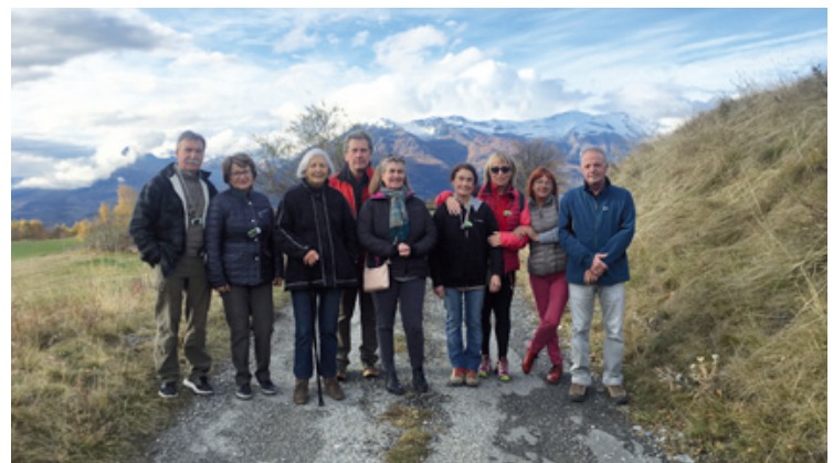
1 ère balade du groupe D-marche le 8 novembre

Actuellement, en plus de la marche liée à leurs activités quotidiennes (ménage, bricolage, jardinage...), une fois par semaine l'après midi, les 15 orriens composant le groupe, se retrouvent pour une sortie pédestre. Peu importe si les rythmes de marche sont différents. Chacun va à son rythme et finit par se retrouver pour un moment convivial. On le constate, heureusement, pas besoin de s'inscrire dans un club de sport pour allier activité physique, santé et plaisirs. Bonne marche à tous!