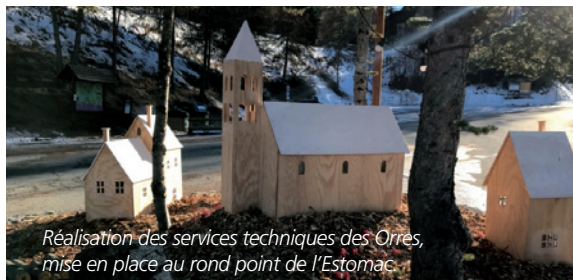
Réalisation des services techniques des Orres, mise en place au rond point de l'Estomac.