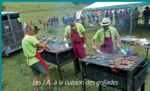
Les J.A. à la cuisson des grillades

Les Jeunes Agriculteurs d'Embrun-Guillestre, les acteurs de la filière bovine en partenariat avec la Chambre d'Agriculture des Hautes-Alpes, la Mairie et l'Office de tourisme des Orres ont fait découvrir la vie de l'alpage du Grand Vallon le mercredi 25 juillet.