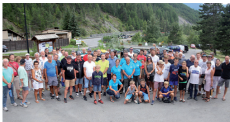
Une partie des 52 équipes de boulistes avec les membres du comité des fêtes, avant le début du concours.

A 14h30, près de 200 personnes étaient présentes pour participer aux différentes activités proposées. 52 équipes étaient inscrites au concours de pétanque.