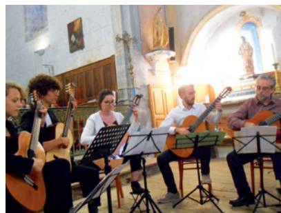
Concert final des élèves et des Maîtres, venant du monde entier, de l'Université d'été du Lions Club

Les Orres sont un partenaire historique du Lions Club depuis des décennies.