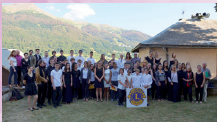
Dans le jardin, devant l'église Ste-Marie-Madeleine au Chef-lieu des Orres le Samedi 29 juillet 2017

artistes (certains n'étant âgés que d'une dizaine d'année), venus des différents conservatoires européens, d'Europe de l'est, des États-Unis, du Moyen-Orient, d'Asie et de plusieurs communes de France.