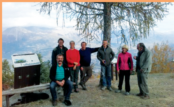
A «Plat Aiguille» : Les gardes ONF, élus de Baratier, élus des Orres

Moment de vrais échanges constructifs dans un esprit d'un amical respect. Un réel plaisir de se retrouver dans notre belle forêt aux couleurs d'automne.