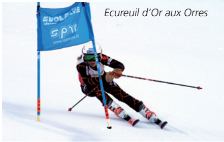
Ecureuil d'Or aux Orres

Grâce à vous, nous avons la possibilité et la responsabilité d'organiser 3 courses FIS féminines sur la 3ème semaine du mois de janvier 2018. Pour cela, nous devons rééquiper la piste de la Pousterle en filets « A » neufs. C'est un énorme budget pour notre club auquel contribuent également la Région, la Commune des Orres, et la SEMLORE.