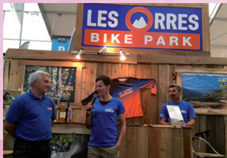
Signature du partenariat entre Anne-Caroline CHAUSSON et la station des Orres lors du Roc d'Azur début octobre

Une fréquentation en hausse, un bike park plébiscité, des événements en vogue... La saison été 2017 a de quoi satisfaire. Côté SEMLORE, on constate une hausse du chiffre d'affaires de 12 % par rapport à l'année dernière et 20 % par rapport à la moyenne des trois dernières saisons. La station a également signé un partenariat avec Anne-Caroline CHAUSSON, multiple championne du monde de VTT. Les Orres orga-