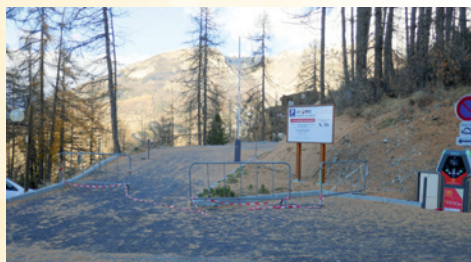
Entrée du parking du Méale