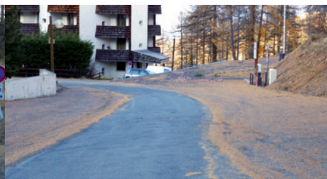
Allée des Chamois

Le programme voirie 2017 concerne le goudronnage de l'entrée du hameau des Sagnettes, de l'Impasse de la Pinatel au Mélezet, de l'entrée du parking des saisonniers (parking du Méale) aux Orres 1650, et des accotements de l'allée des Chamois. Les déformations de la route de la Mazelière au Mélezet ont été reprises. Ces travaux (réalisés par les sociétés COLAS et La Routière du Midi) ont engendré une dépense de 89.976 € TTC.