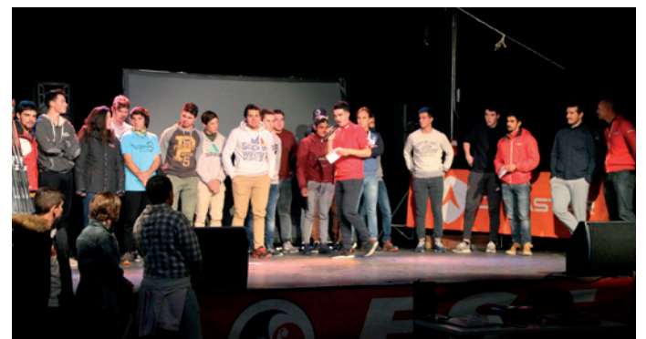
Passage de flambeau entre les deux promotions

Ce fut une cérémonie empreinte de solennité mais joyeuse, tonique et généreuse, avec cette belle jeunesse, avenir de nos métiers de montagne.