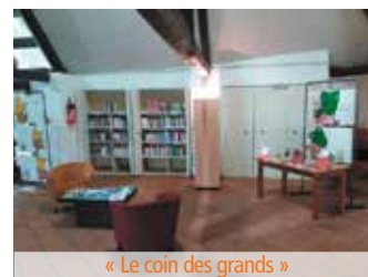
« Le coin des grands »

L'inscription est gratuite. Heures d'ouverture : Mardi de 16h à 18h Mercredi de 14h à 18h Samedi de 10h à 13h