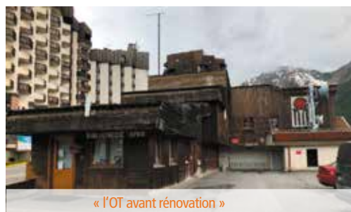
« l'OT avant rénovation »

Il sera prêt à accueillir du public dès le début de la saison d'hiver ! Prochaine étape : la mise en valeur des abords du bâtiment via la rénovation et l'aménagement de la place des Etoiles au printemps 2022.