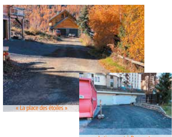
« La place des étoiles »

Les principaux lieux d'intervention sont : le Pont, le Mélezet, Le Chef-Lieu, le Château, Pramouton et le Centre Station 1650 mais de l'entretien a été ponctuellement réalisé sur toute la Commune afin de maintenir le bon état et la sécurité de nos routes.