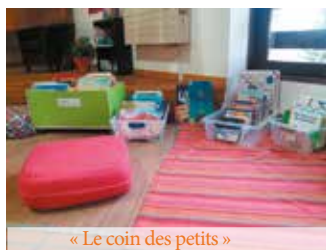
« Le coin des petits »

En attendant l'ouverture de la nouvelle médiathèque, vous pouvez venir passer un moment dans la bibliothèque actuelle dans le Salle de Prince au Chef-Lieu. L'espace a été réaménagé afin de le rendre plus convivial et chaleureux. Un travail sur les collections a déjà commencé alors n'hésitez pas à venir voir les nouveautés et à demander conseil.