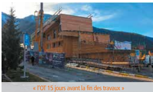
« l'OT 15 jours avant la fin des travaux »