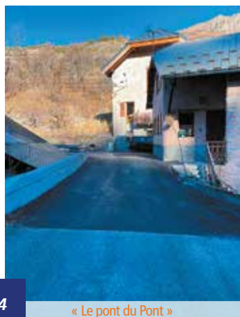
« Le pont du Pont »

Dans le cadre du programme voirie de 2021, la Commune a réalisé en régie de l'entretien mais a également délégué aux entreprises Colas et la Routière du Midi des travaux de réfection et des 1ères sessions d'enduit dans le but d'améliorer l'accès à certaines habitations jusqu'ici desservies par des chemins non goudronnés.