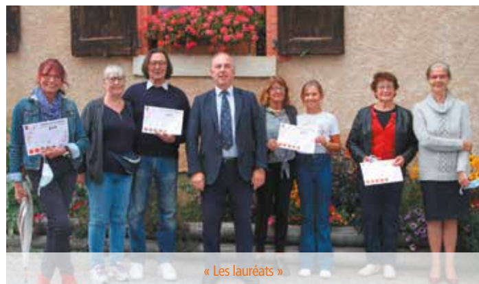
« Les lauréats »

Ce concours a été l'occasion pour le Jury de constater une fois de plus le travail remarquable de l'employé communal en charge du fleurissement.