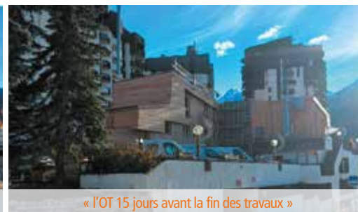
« l'OT 15 jours avant la fin des travaux »