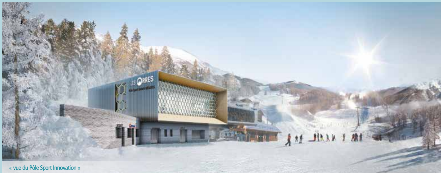
« vue du Pôle Sport Innovation »

Le bâtiment sera situé au-dessus d'un parking de 160 places, qui s'étendra sous le jardin d'enfants de l'ESF.